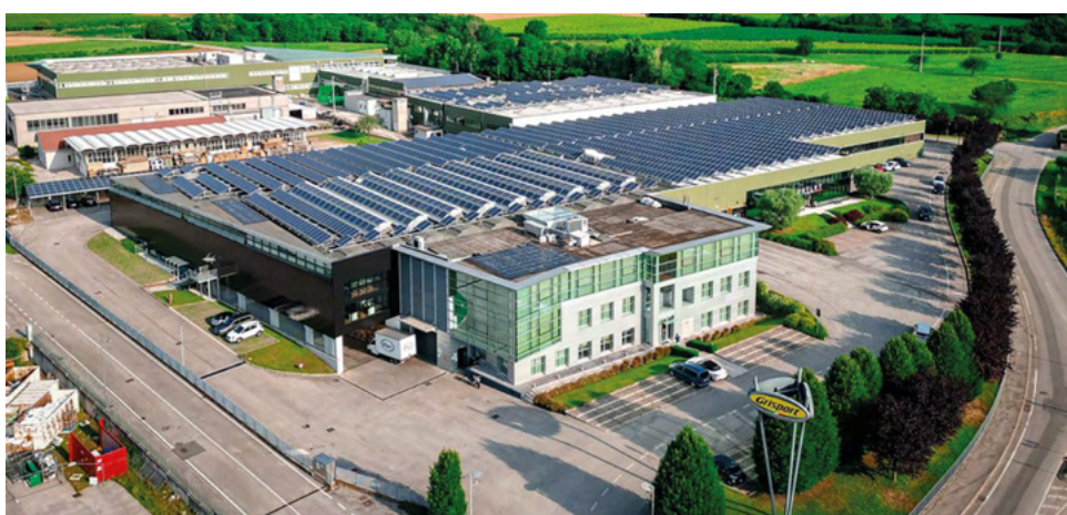
Les chaussures sont fabriquées dans une usine de production ultramoderne en Italie.

«Rouben avait de l'expérience sur la ferme et en construction et moi j'étais enseignante», de dire Vicky. «Nous avons travaillé sur la ferme au début et une dizaine d'années passées, on a commencé à créer nos propres chaussures de sécurité. Mais on continue aussi de gérer cette ferme laitière.»